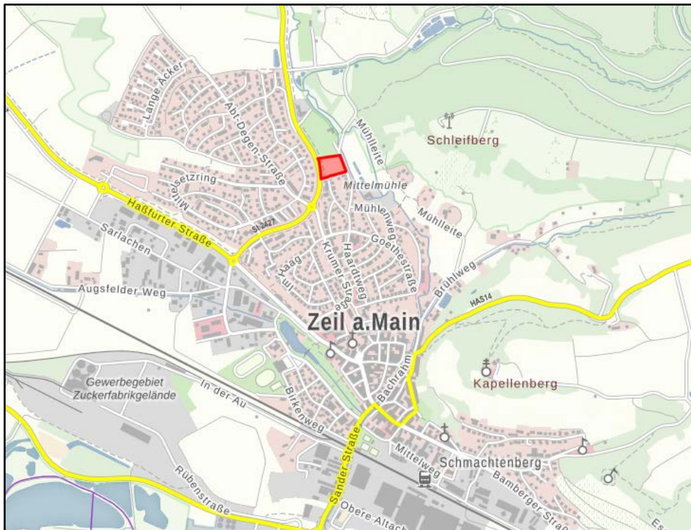
Abb. 2: Lage im Ort, Bayerische Vermessungsverwaltung 2022